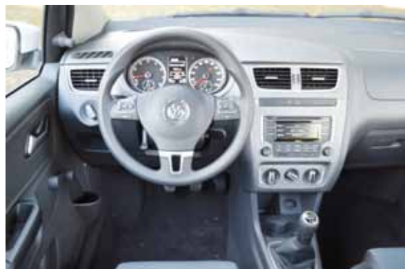
Painel completo, com eficiente computador de bordo

Enquanto isso, não me importo em ter um carro que permite rodar 500 km em 10 dias que consome 1/2 tanque de combustível. Ainda que seja um Fox. 1/5A