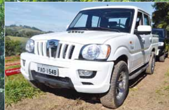
A frente foi renovada, mas ainda tem aparência antiquada

Com design que lembra os antigos Toyota Bandeirante, a picape indiana quer conquistar pela robustez e menor custo