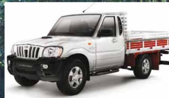
Na opção cabine simples, caçamba de madeira é opcional

A indiana Mahindra apresentou o novo utilitário PIK UP nas versões cabine simples e dupla, ambas com motor turbo diesel 2.2 litros, de 120 cv a 4.000 rpm e torque máximo de 29,5 kgfm entre 1.600 a 2.800 rpm, e tração 4x4, com reduzida.