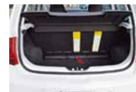
O pequeno motor 3 cilindros, detalhe do painel de instrumentos e o porta-malas de 260 litros

A Volkswagen surpreende ao antecipar o lançamento do motor três cilindros em versão 'verde' do Fox