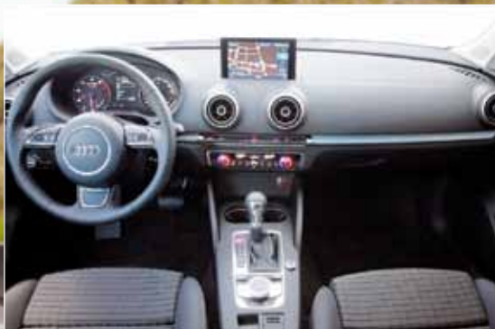
O interior ficou mais sofisticado, com botão touch ao centro