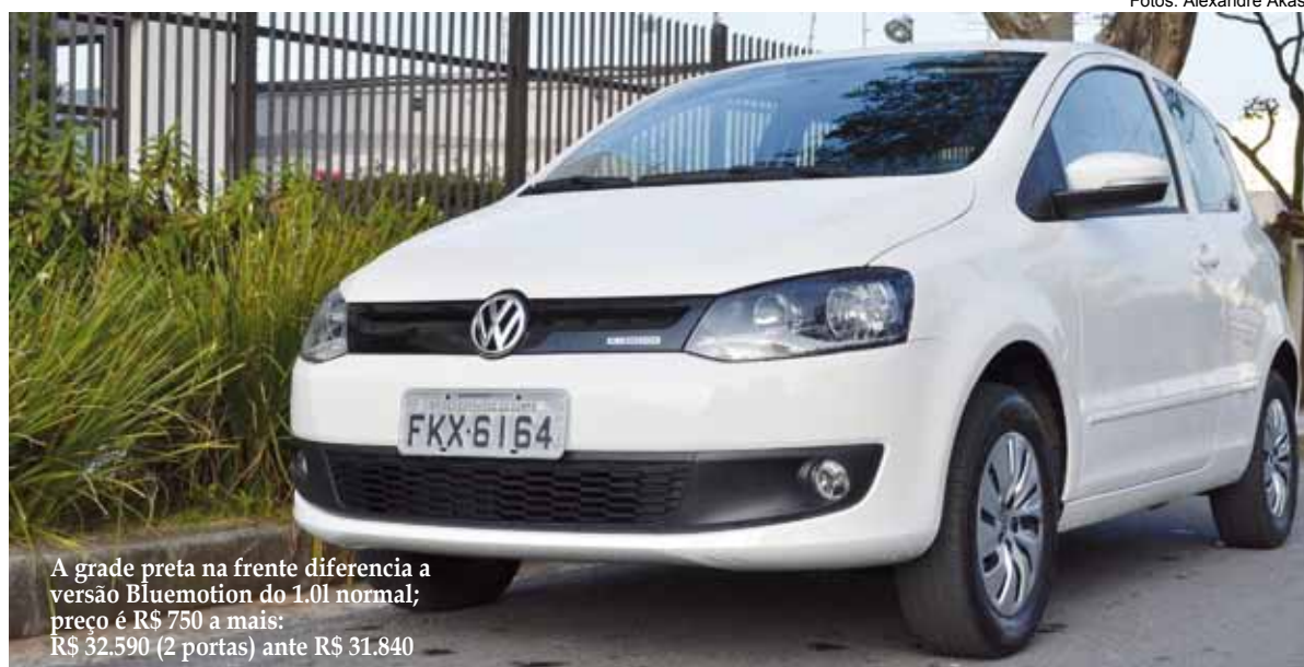
A grade preta na frente diferencia a versão Bluemotion do 1.0l normal; preço é R$ 750 a mais: R$ 32.590 (2 portas) ante R$ 31.840

velocidade máxima de 167 km/h/166 km/h (e/g)