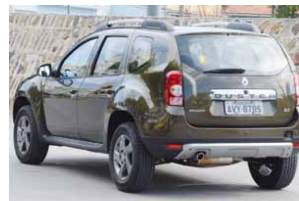
O estilo é rústico, mas foi feito mesmo para a cidade

Duster é muito bom. Mesmo sendo alto, não tomba excessivamente nas curvas, e o motor 2.0 litros de 142 cv (etanol) é bastante esperto.