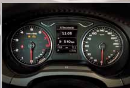
Indicadores digitais mostram temperatura e nível de combustível