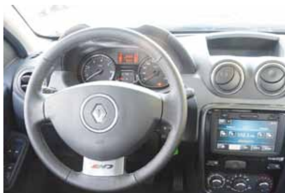
O navegador GPS fica no centro do painel, difícil de ver

Em linhas gerais, o Duster é uma boa escolha. Pena que o preço não ajuda muito. JFA