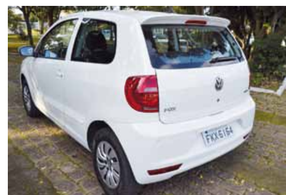
Modelo avaliado tinha sensor de estacionamento

ainda não convenceu foram os pneus verdes. São excelentes em piso seco, mas no molhado... para se ter ideia, na semana de teste choveu muito em São Paulo e, no plano, em segunda marcha, as rodas patinavam ao apertar o acelerador com força, e isso porque o motor só desenvolve 9,7 mkgf de torque